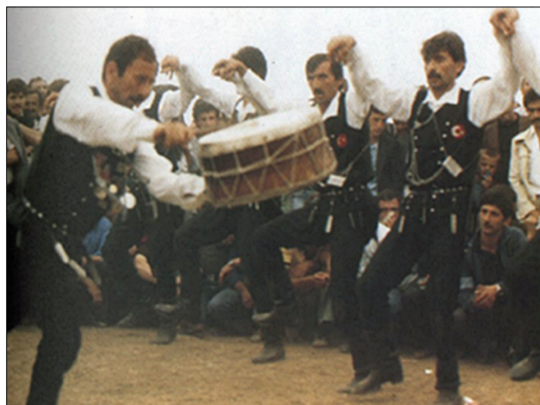
Ил. 4. «Пиррихий» или «Серра»

Танец «Пиррихий» у понтийского народа имеет второе название – «Серра». Сегодня он является одним из самых распространённых и любимых танцев понтийцев по всему миру. Это мужская военная пляска, которую мужчины исполняют перед боем. Движения танцоров очень активны, экспрессивны. Танцоры совершают характерные потряхивания телом, прыжки, сильные удары ногами о землю, приседания, резкие повороты, выкрики, остановки, потом вновь возвращаются к движению. Танец продолжается, пока танцоры не остановятся (ил. 4).