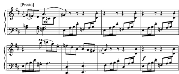
Пример № 1 Д. Скарлатти. Соната К. 492, т. 25–32

Здесь андалусский Ми дан с типично гитарной квартовой гармонией первой ступени и педалью h на квинте лада. Совершенно в духе барокко композитор подчас использует «причудливые» аккорды, вмещающие одновременно терцию, кварту, квинту и септиму, например, e-gis-a-h-d' .