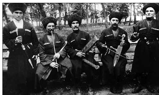
Photo 2. Performers of Traditional Adyghe Music. Kabardino-Balkaria, Zayukovo village, 1935

The Adyghe songwriters who enjoyed great renown and popularity, as well as the entire folksong performance school, were conducive to the formation in the folk musical legacy with a special type of correlation of the collective and individual elements. The personalized consciousness of the active bearers of folklore, the singers, dancers and performers on folk instruments noticeably extend and broaden the subjective world of creative self-expression, enriching the descriptive-expressive and structural-formative sides of folksong.