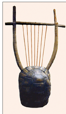
Ил. 2. Ли́ра Древней Греции

извлечения понтийская лира – это принципиально иной инструмент. И. Шабунова приводит следующее описание античной лиры: «Ли́ра – это древнейший греческий щипковый инструмент, с мембраной из панциря черепахи. Она, вместе с кифарой, являлась усложнённым видом форминги, самого древнего греческого четырёхструнного образца, о котором упоминает ещё Гомер. На лире играли дети и подростки» [9, с. 110].