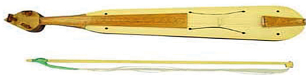
Ил. 1. Понтийская лира

Н. Ф. Тифтикиди также утверждал в своих работах, что понтийское музыкальное искусство – явление синкретичное. Оно включает в себя сплав пения, танца и инструментального сопровождения.