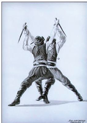
Ил. 3. Танец «Махери»

племя греческого происхождения имело свой танец с оружием в руках, и отличались они лишь ударами оружием по щиту [8, с. 84]. Вот так, видимо, и понтийцы как потомки эллинского происхождения имели свой пиррихий.