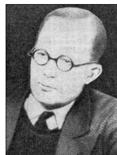
Лаури Карлович Йоусинен (1889–1948) – советский композитор, альтист, педагог, член Союза композиторов СССР (1937)

Одним из ведущих музыкантов в 1920–1930-е годы стал Л. Йоусинен, прибывший в Карелию вместе с Раутио. Йоусинен выступал и как солист, и как камерный исполнитель, и как композитор. П. Суутари, изучавший жизнь финских иммигрантов в Карелии, писал: «Жизненные пути Раутио и Йоусинена долгое время шли параллельно: сначала из Америки в Карелию и педагогическое училище, отсюда в симфонический оркестр и Союз композиторов. Вместе они писали музыку для Петрозаводского финского театра и в разное время возглавляли оркестр и хор в Ухте: Йоусинен – в 1926–1931 гг., а Раутио – перед войной» [7, с. 237].