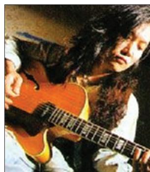
4. Мьён Вун Юн – автор блюзовых композиций (Республика Корея)

Известный музыкант из Сеула Мьён Вун Юн (фото 4) планирует включить в будущий блюзовый альбом композицию на русскую тему. Режиссёр спектакля «Шершавый песок» Лим Хьён Тэк,