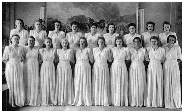
1. Первый женский состав Магнитогорской хоровой капеллы, 1944 г.

Первые самостоятельные творческие шаги были связаны с симфоническим оркестром, музыкальной школой и училищем. Но в 1944 году в городе появилась возможность открыть профессиональную хоровую капеллу, впоследствии – одного из прославленных творческих коллективов страны. Так окончательно определилось исполнительское призвание ведущего хорового дирижёра России Семёна Григорьевича Эйдинова, ставшего её руководителем.