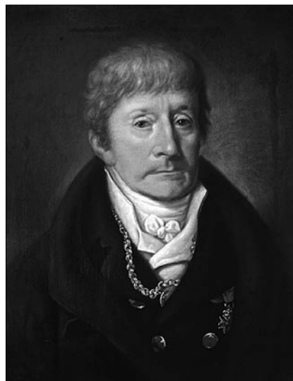
Ил. 2. Антонио Сальери (1825, Вена). Портрет работы В. И. Малера

Переработкой опер Сальери занимался до 1822 года, несмотря на то, что уже с 1820 года он страдал от подагры. Эта болезнь сопровождалась сильной болью и окоченением суставов, а весной 1825 года добавилось глазное заражение. Параллельно с этим ухудшалось и душевное здоровье композитора. В октябре 1823 года его положили в Венский всеобщий госпиталь, где он и умер в мае 1825 года.