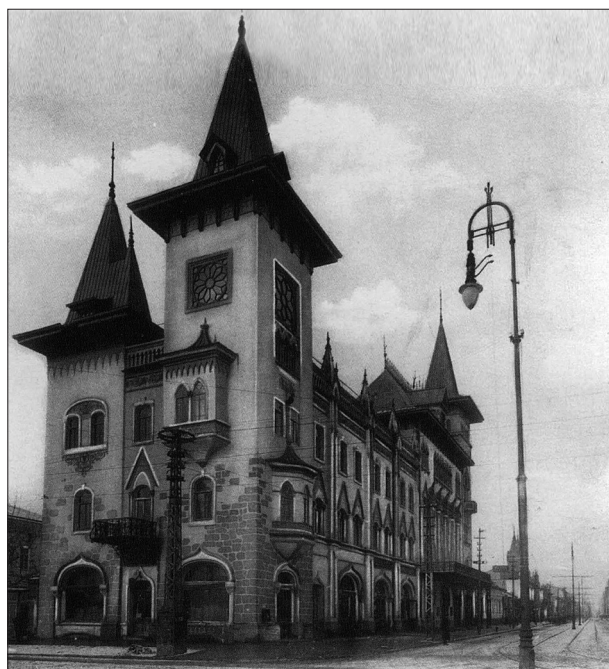
Здание Саратовской консерватории времени её открытия, 1912 г.