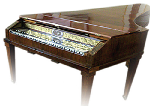
Фортепиано в Доме-музее Гайдна в Вене

Вы видите сокращённую запись пьесы для клави́ра, основанной на фрагменте Симфонии Гайдна № 96 Ре мажор, «Миракль» («Чудо»)². Она выглядит как весёлая танцевальная пьеса для фортепиано.