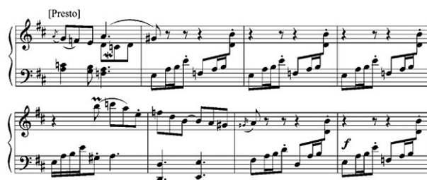
Пример № 1 Д. Скарлатти. Соната К. 492, т. 25–32

Здесь андалусский Ми дан с типично гитарной квартовой гармонией первой ступени и педалью h на квинте лада. Совершенно в духе барокко композитор подчас использует «причудливые» аккорды, вмещающие одновременно терцию, кварту, квинту и септиму, например, e-gis-a-h-d' .