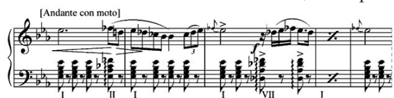
Пример № 7 Дж. Верди. «Аида», I д. Большая сцена и финал

Чередование аккордов фригийского каданса имеет место и в русской «музыке о Востоке». Так, в хоре «Ноченька» из оперы «Демон» А. Рубинштейна ориентальный характер сочетается с выражением нарастающего чувства тревоги, ожидания неизбежного (пример № 8).