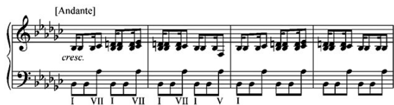
Пример № 8 А. Рубинштейн. Хор «Ноченька»

Таким образом, андалусский лад, привлекательный в научном плане как автохтонная и устойчивая в своём бытовании «чистая культура» (как сказал бы биолог), в конечном счёте – лишь частное проявление ладообразующего принципа, противостоящего принципу, формирующему нашу тональную систему.