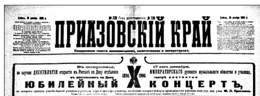
Ил. 10. Объявление о юбилейном концерте отделения ИРМО. 1906 г.

и зарубежных композиторов (П. И. Чайковский, С. В. Рахманинов, Ц. А. Кюи, Дж. Верди, Ф. Лист и др.).