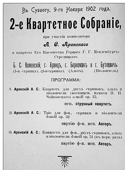
Ил. 8. Афиша концерта А. С. Аренского и квартета герцога Мекленбург-Стрелицкого

По данным отчётов за десять лет существования отделения были устроены 56 квартетных собраний, проведены 19 симфонических и иных концертов,