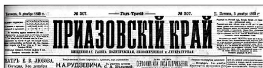
Ил. 1. Газета «Приазовский край»

Однако к концу XIX века ситуация начинает меняться: у ростовчан постепенно формируется интерес к серьёзной музыке, в том числе и оперным спектаклям. Свою лепту в этот процесс внесли гастролёры. Так, театр В. И. Асмолова, специализирующийся на драме, нередко принимал приезжих музыкантов с оперными постановками. Например, в 1893 г. под эгидой театра проходил цикл постановок «Русская опера» с участием как приглашённых, так и своих артистов [4]. Другим источником, стимулирующим рост интереса в городе к серьёзной музыке, была консолидация местных творческих сил.