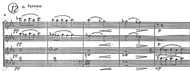
Пример № 4 Р. Леденёв. «Контрасты», I часть

Другая сфера представляет некую объективную реальность, с её драматизмом, стремительным бегом времени к неумолимо приближающемуся «концу». Ей свойственны резкие динамические всплески, быстрый темп, насыщенность фактуры (пример № 5).