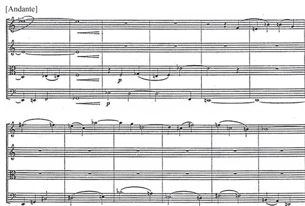
Пример № 6 А. Эшпай. Квартет

Стилевое родство музыки с сочинениями Шостаковича особо присуще квартету Николаева. Так, I часть начинается с темы у солирующей виолончели. Темп Moderato, наряду с восходящими поступенными движениями, заключёнными в амбитус кварты, фактурой с элементами полифонических подголосков и тональностью C dur весьма схожи по звучанию с началом I части Первого квартета Шостаковича (примеры № 7 а, № 7 б).